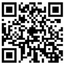
Hier geht's zur Hitzeschutz-Seite des Enzkreises

Weitere Informationen finden Sie auf unserer Hitzeschutzseite: www.enzkreis.de/Hitzeschutz