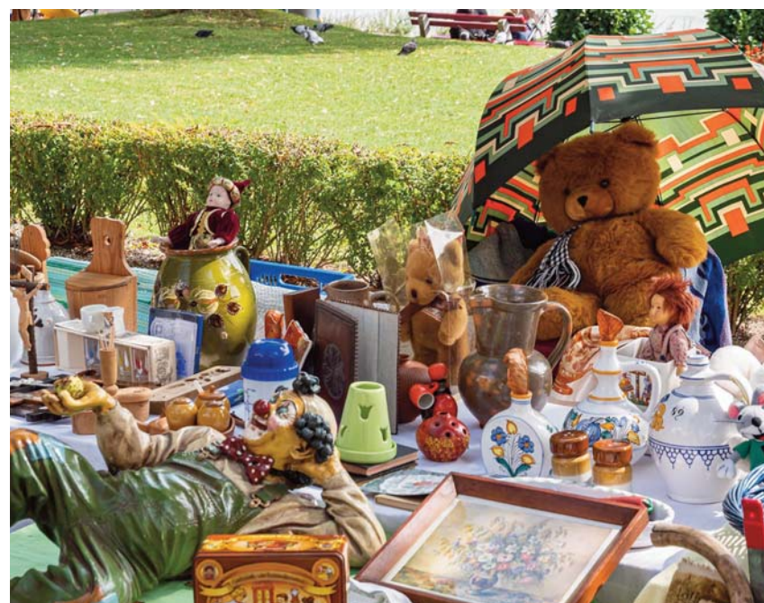
Zahlreiche Flohmärkte im Enzkreis bieten ein zweites Leben für Gebrauchtgüter