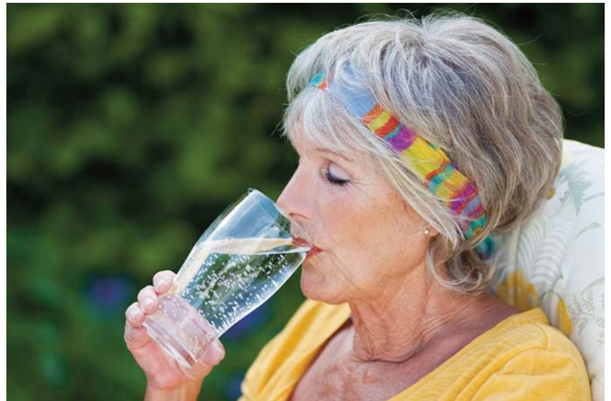
Ein Schlüssel zum effektivsten Hitzeschutz: Ausreichend Flüssigkeit

Eine Zukunft mit 2,8° C Erwärmung ist nicht unvermeidbar, sie liegt in unserer Hand. Wir müssen lernen,