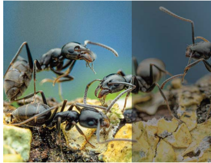
Im Enzkreis angekommen: Tapinoma magnum