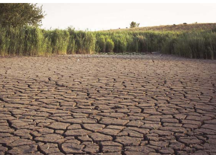
In Zukunft könnten öfter auch Fischweiher und Bäche im Enzkreis austrocknen