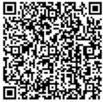
Informationen über regionales Einkaufen